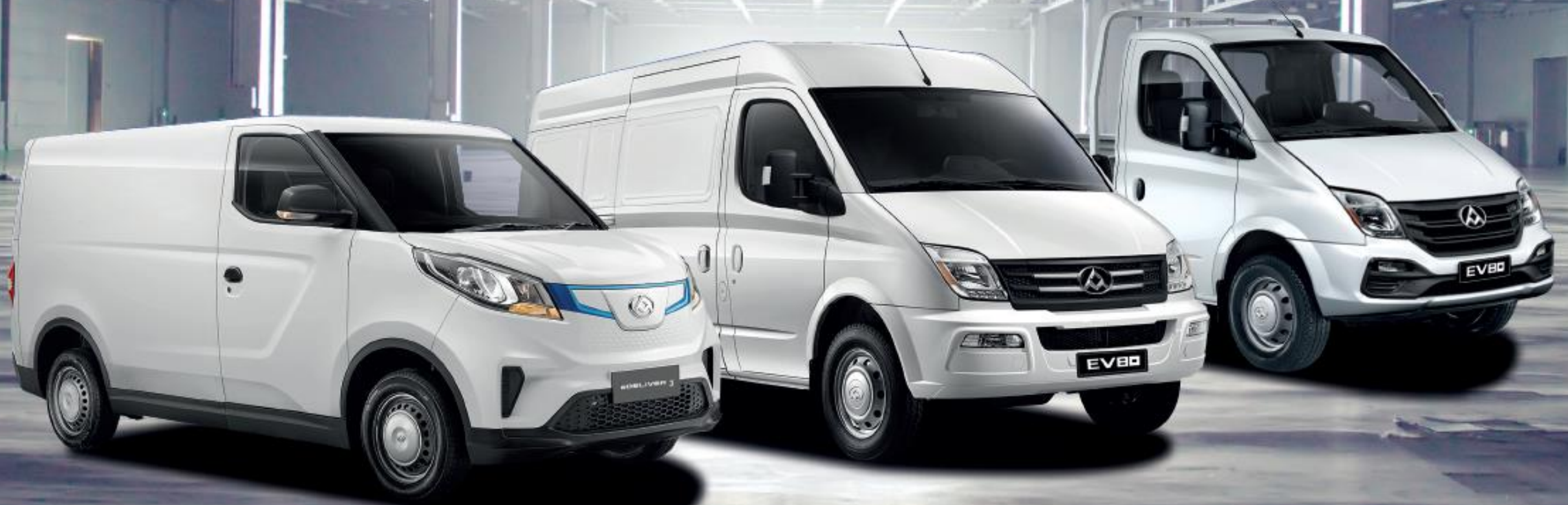
Maxus eDELIVER 3.