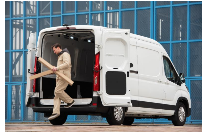
Bilder: Variante L2H2